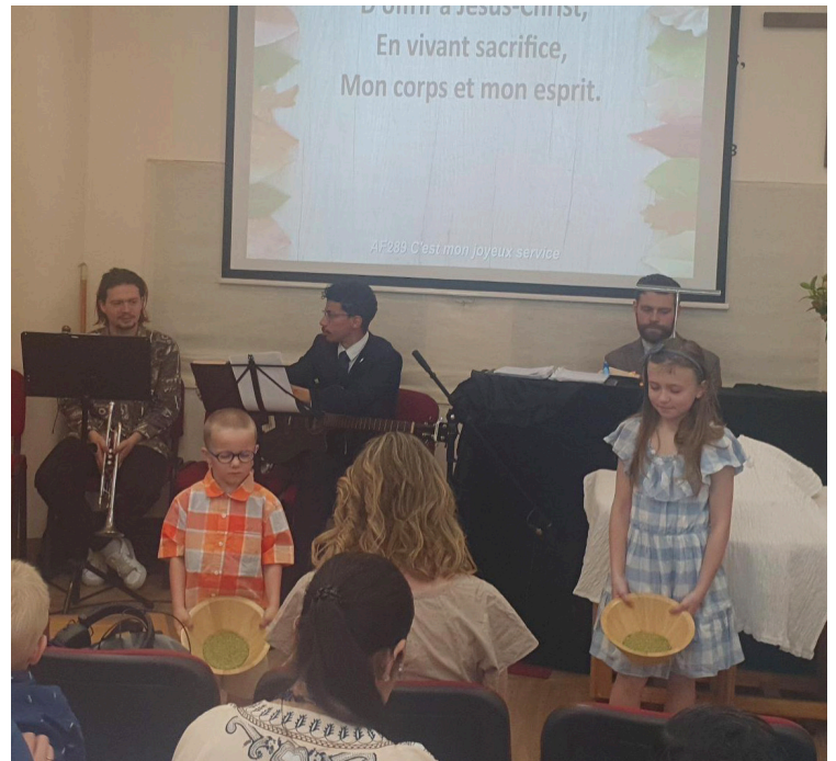
Les enfants à l'offrande (prions pour qu'ils grandissent dans leur envie de participer aux œuvres de l'église !)