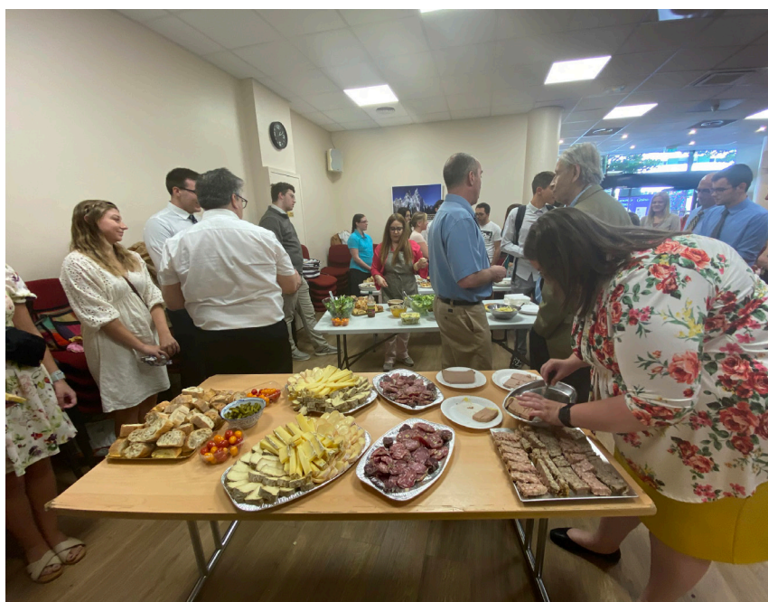
Photographies du repas