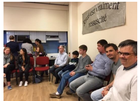
Les jeunes américains à la réunion de prières du lundi