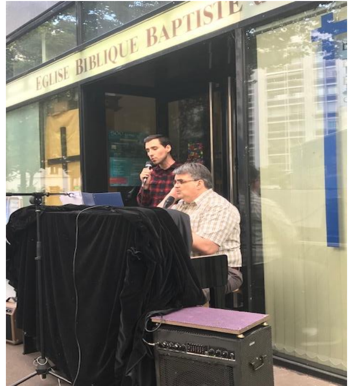
Des duos, des quatuors ont chanté devant l'église